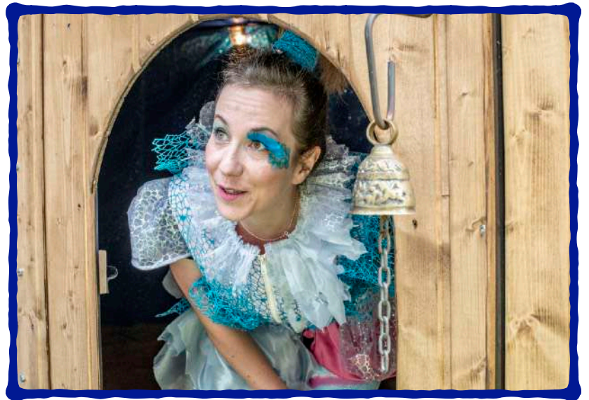
La Fée des Voeux